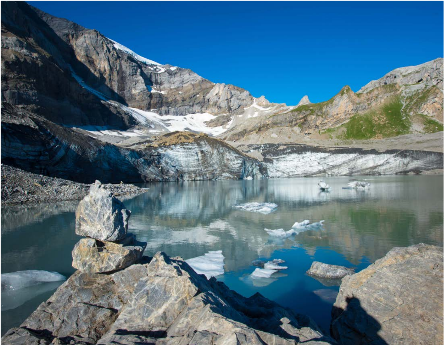
Die Gletscher sind wichtige Wasserspeicher, wie beispielsweise hier der Gletschersee am Fusse des Clariden im Kanton Uri, welche zunehmend unter Druck geraten.

Mit dem Klimawandel und Schmelzen der Gletscher verändert sich der Wasserhaushalt – auch in der Zentralschweiz. In Zusammenarbeit mit dem Bund haben die Kantone rund um den Vierwaldstättersee untersucht, wo und wie sich die Wasserknappheit in Zukunft akzentuieren könnte.